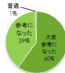
2013年面接官トレーニングアンケート結果